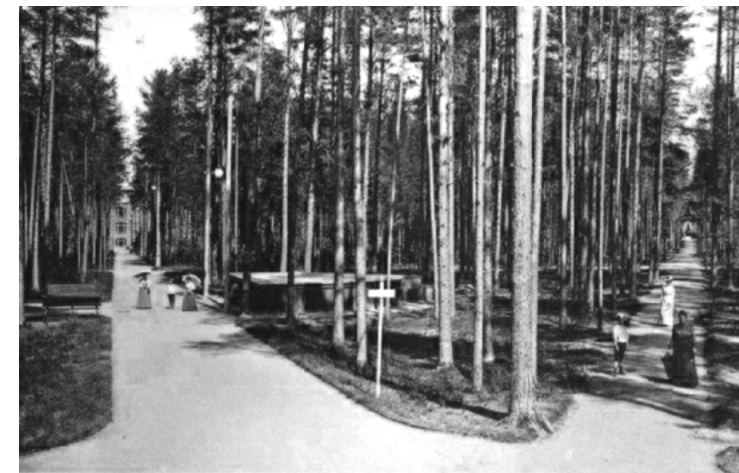
Сестрорецкий Курорт. — Аллея от вокзала к лечебнице и пансионату.